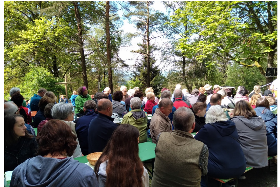
Christi Himmelfahrt an der Gänskopfhütte 2024